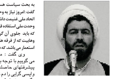
حجت الاسلام و المسلمین رضائی پور با اشاره

برای اولین بار از سوی شورای شهر و شهرداری بندر کنگ به عمل آمد. در این مراسم که جمعی از پرسنل نیروی انتظامی و هیئت همراه و اعضای شورای شهر و شهردار معتمدین و امام جمعه بندر کنگ تشکیل شد ابتدا رئیس شورای شهر پیرامون هفته نیروی انتظامی مطالبی بیان داشت و تصریح کرد: نیروی انتظامی بدنه نظام است و اگر اشکالی به وجود آید دوش به چشم خود مردم خواهد رفت، پس باید نیروی انتظامی را تقویت کرد و مردم هم در کنار نیروی انتظامی مشارکت وسیعی داشته باشند. پس از آن سرهنگ کریمی فرمانده نیروی انتظامی بندر لنگه: